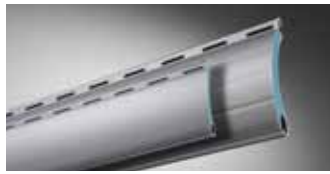
ALUMINO protect, doppelwandig, umweltfreundlich stabil hartgeschäumt

Die untenstehenden maximalen Breiten sind die konstruktiv möglichen Maße. Je nach Region können sich nach DIN EN 13659 (Windwiderstandsklassen) geringere Breiten ergeben.