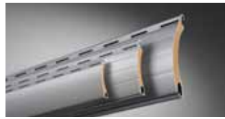
ALUMINO, doppelwandig, umweltfreundlich ausgeschäumt