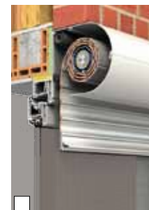
Standardmontage als Linksroller in die Laibung (Abb. XP-System in Klinkerfassade mit Sonderausstattung Insektenschutzgitter)