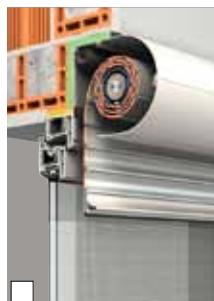
Standardmontage als Linksroller in die Laibung (Abb. XP-System im monolithischen Mauerwerk mit Sonderausstattung Insektenschutzgitter)