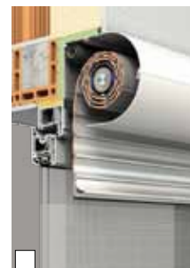
Standardmontage als Linksroller in die Laibung (Abb. XP-System im Wärmedämmverbundsystem mit Sonderausstattung Insektenschutzgitter)