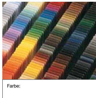
ROMA ColorCollection (Standard) oder andere Farben (Sonderfarben)